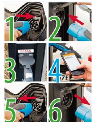
Anleitung am Ladepunkt

Die Abrechnung erfolgt über Ihre monatliche Mobilfunkrechnung oder über Ihr Prepaid-Guthaben. Hierfür müssen Mehrwertdienste (Mehrwert-SMS bzw. Premium-SMS) freigeschaltet sein. Alternativ ist eine Abrechnung über Travipay (siehe oben) möglich.