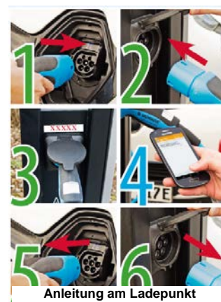
Anleitung am Ladepunkt

Durch das Entfernen des Kabels vom Fahrzeug 5 endet der Ladevorgang und die Abrechnung. Die LED der Ladesäule wechselt von blau auf grün. Sie erhalten eine SMS mit Informationen über die insgesamt angefallenen Kosten. Entfernen Sie noch das Kabel von der Ladesäule 6 .